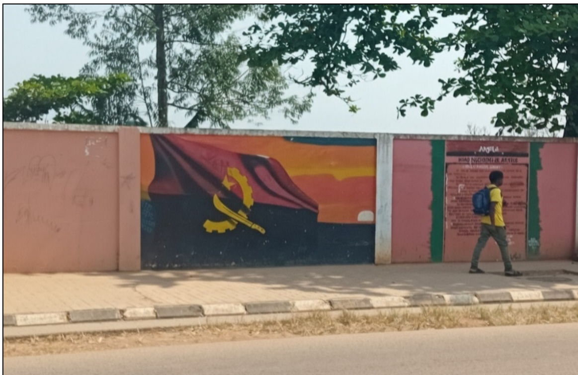
Fresque murale avec drapeau angolais, dans les rues de Uíge