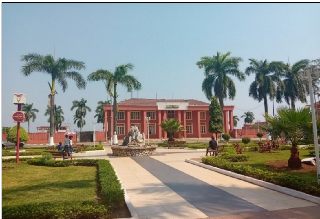
La place devant le bâtiment du gouvernorat de la province de Uíge

Dans les provinces, la situation varie en fonction des régions 574 . Dans certaines villes, comme par exemple à Uíge, les organisateurs d'une manifestation risquent d'être dénoncés aux autorités, qui vont empêcher son déroulement. Des travailleurs employés dans des fermes agricoles ( fazendas ), qui se déplaçaient sur des motos à trois roues, ont été empêchés par les autorités provinciales de circuler avec ce type de véhicule, sans qu'aucun mode transport alternatif ne leur soit proposé pour se rendre sur leurs lieux de travail. De ce fait, ils ont décidé de manifester devant le palais du gouverneur de la province de Uíge, mais les autorités sont intervenues pour les disperser ou les arrêter, avant de les relâcher peu après 575 .