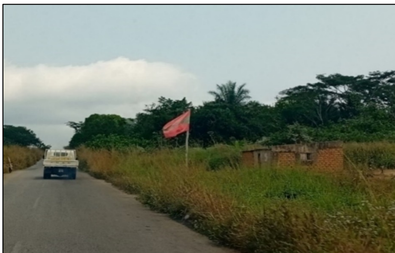
Drapeau de l'UNITA dans un village sur la route de Luanda à Uíge

Quand l'UNITA organise un événement dans un lieu, le MPLA en fait parfois de même pour semer le chaos. Cela fut notamment le cas en mars 2022 à Sanza Pombo, où des heurts entre militants de l'UNITA et MPLA ont éclaté . A l'issue de ces violences, les partisans du MPLA n'ont pas été inquiétés, mais, au lendemain des faits, 27 membres de l'UNITA ont été arrêtés à Uíge par la Police d'intervention rapide (PIR). La direction de l'UNITA est venue spécialement de Luanda à Uíge pour protester formellement contre l'arrestation de ses militants. Ces derniers ont été relâchés après quatre mois de détention 492 .