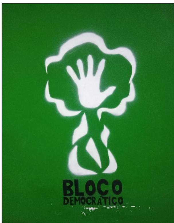
Fresque murale dans les locaux du BD à Luanda

Le BD est issu d'une autre force politique, le Frente para a Democracia (FPD), qui a été dissoute en 2008. Il fonctionne selon le principe de la démocratie participative, avec une direction collégiale qui compte de nombreux jeunes membres 430 .