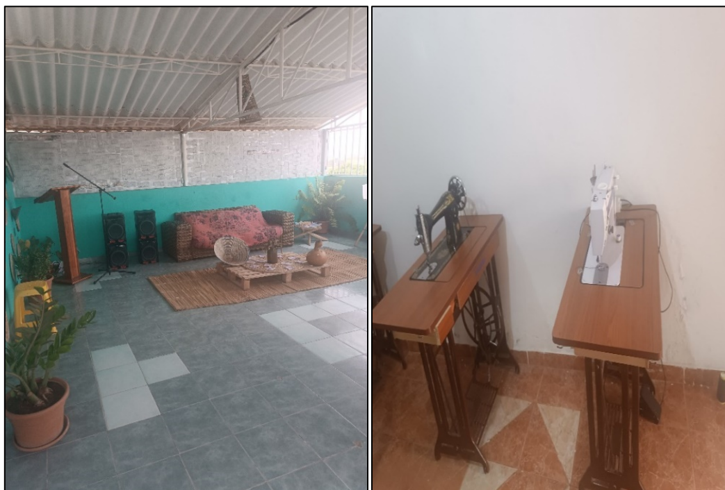
Espace dédié aux activités culturelles et salle dédiée à la couture dans les locaux d'AIA

professionnelles en couture, langues et informatique. Il accueille également des cercles de discussion, des ateliers d'autonomisation et divers événements communautaires. L'initiative, qui existe depuis 2018, a connu plusieurs déménagements en raison de pressions et de menaces , avant de s'installer dans ce quartier plus ouvert, même si la sécurité y reste une préoccupation permanente. 231