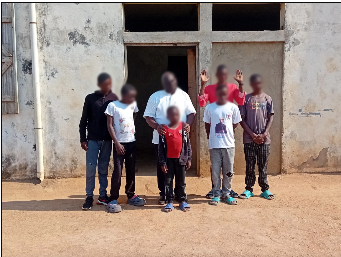
Refuge pour enfants accusés de sorcellerie à Uíge, fondé et dirigé par des prêtres catholiques, membres de la congrégation des Pauvres Serviteurs de la Divine Providence