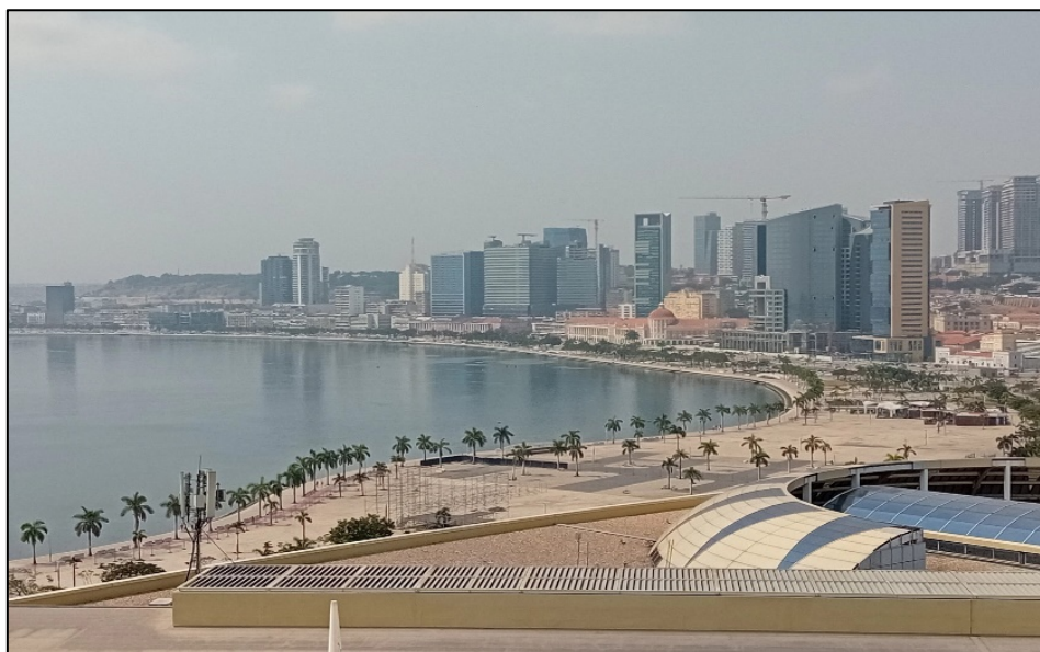
La baie de Luanda

Dans les années ayant suivi la fin de la guerre civile, 371 à la faveur d'un cours du pétrole élevé, les indicateurs économiques étaient très encourageants. De 2002 à 2008, le produit intérieur brut (PIB) a nettement augmenté, si bien que « tout le monde se gargarisait des résultats économiques de l'Angola ». Toutefois, durant ces années de croissance, le pays est resté à la même position (la 149 ème ) à l'Indice de développement humain (IDH), car la population n'a pas tiré profit de cet essor économique, qui ne s'est jamais traduit en termes de développement pour le pays. 372