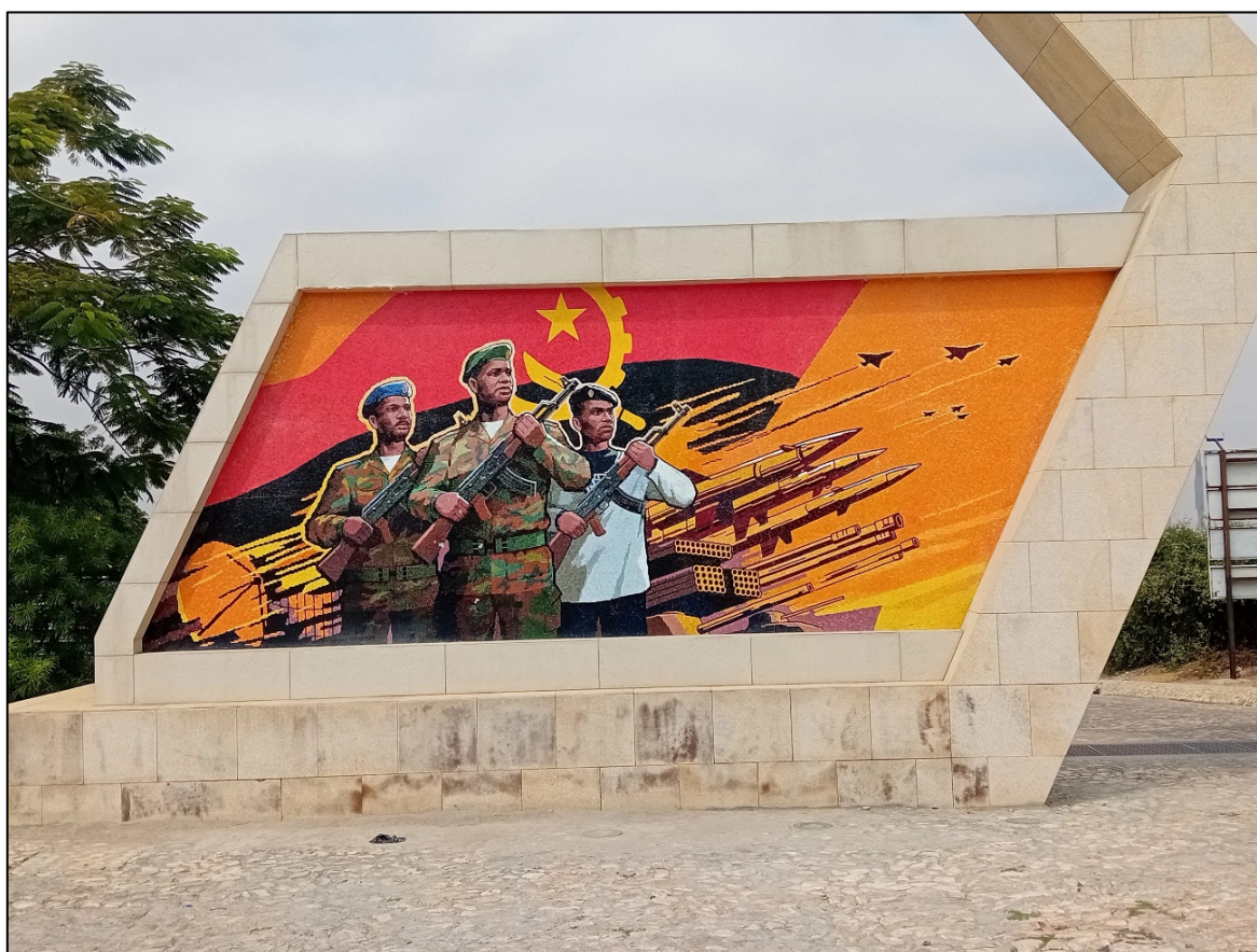
Fresque à l'entrée de la forteresse São Miguel à Luanda